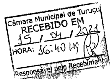
Ivan Eduardo Scherdien Prefeito Municipal de Turuçu